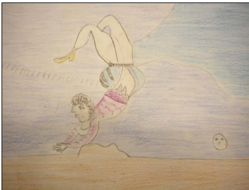
Riproduzione dell'opera "Acrobata" di Gioia