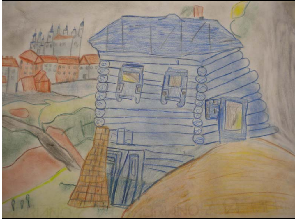
Riproduzione dell'opera "La casa blu" di Federico