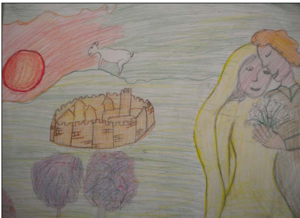
Riproduzione dell'opera "Les amoureux de Vence" di Andrea V.

Si sposano e vivono per sempre felici e contenti!