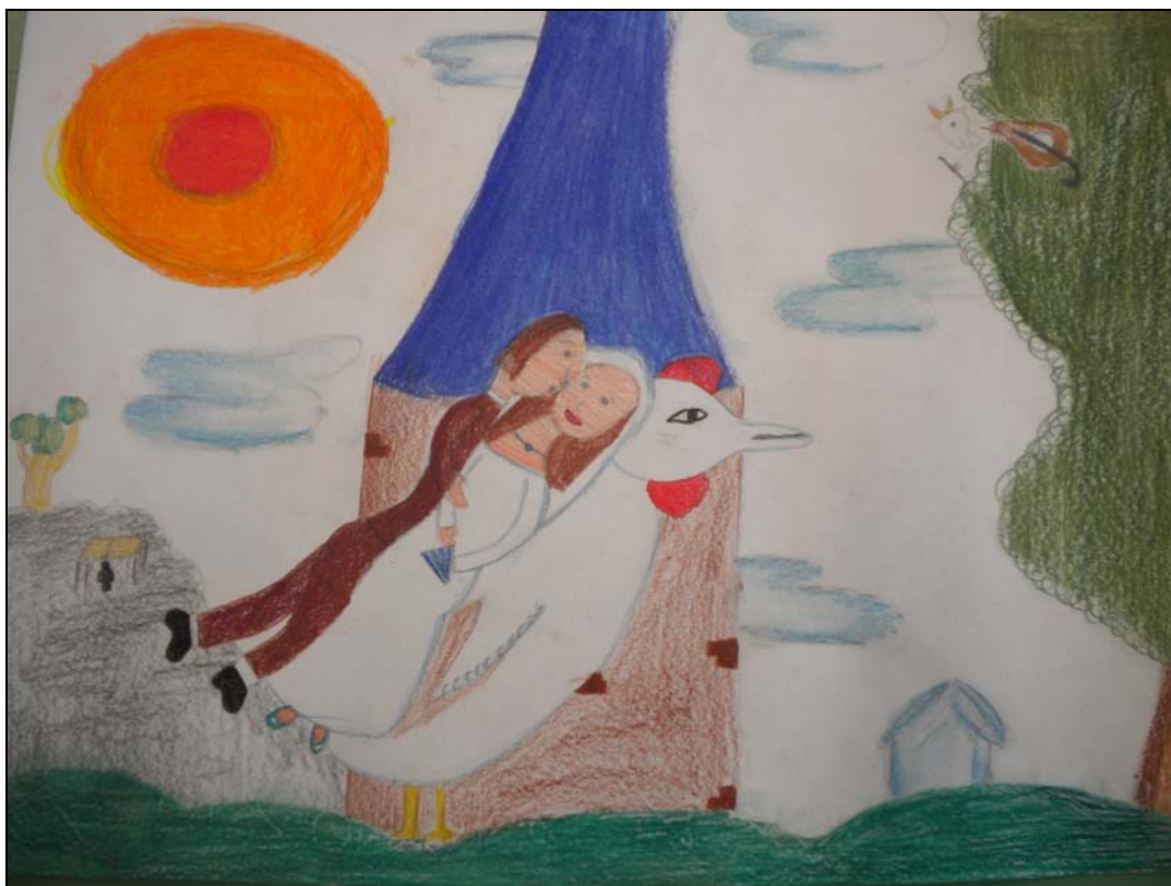
Riproduzione dell'opera "Nozze" di Iris

Si sposano e vivono per sempre felici e contenti!