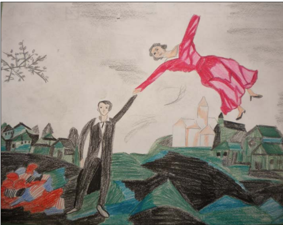
Riproduzione dell'opera "Promenade" di Alessandro

Dall'opera artistica di Marc Chagall al laboratorio di scrittura creativa