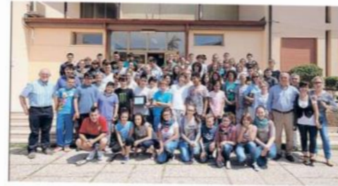
Sopra, tutte le classi di Porto Viro, la scuola che ha battuto tutti anche quest'anno. In basso, la consegna della targa.