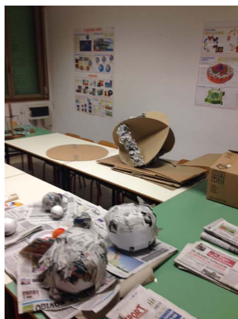
Realizzazione dei pianeti in scala del sistema solare