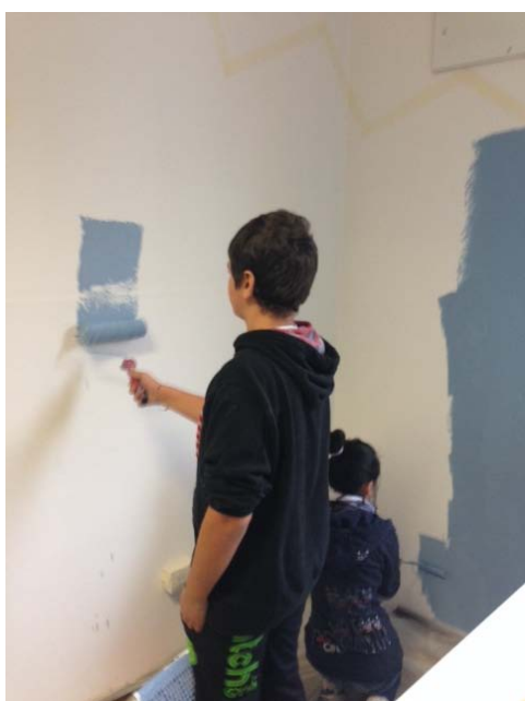
Alcuni studenti coinvolti nella tinteggiatura delle pareti