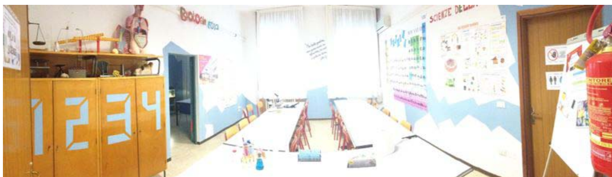
La prima delle due aule di scienze