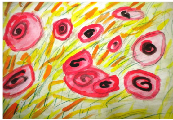
Campo di grano e papaveri