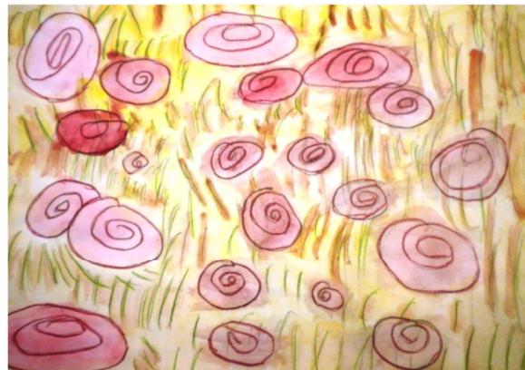
Campo di papaveri